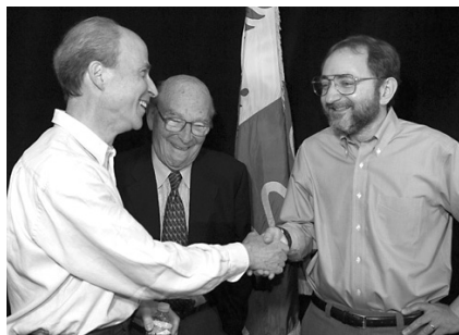
Roger D. Kornberg (1947- ) Stanford University School of Medicine, CA (USA).

Nella foto è il primo a sinistra; con lui il padre Arthur, premio Nobel per la medicina e fisiologia nel 1959 e Andrew Fire, premio Nobel 2006 per la medicina e la fisiologia.