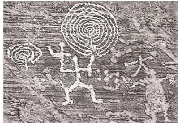
Graffiti camuni a Capo di Ponte (val Camonica)

La composizione in neuroni del cervello risentirebbe, cioè, di un processo dove il caso gioca un ruolo. Sarebbero implicati, particolarmente, eventi traspositivi, frequenti nelle divisioni precoci dello zigote, tali da conferire, eventualmente, vantaggi selettivi ai cloni di cellule neuronali risultanti. Per questo la formazione di un cervello rappresenta un evento irripetibile anche per uno stesso genoma che, in potenza, avrebbe la capacità di sviluppare un gran numero di cervelli alternativi [20].