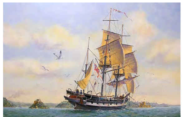
Il dipinto raffigura il brigantino Beagle, su cui Darwin compì il giro del mondo

Rimane la ricerca, discussione e presentazione organica dei risultati disponibili per piante e animali che illustrano gli effetti della selezione. Nell'insieme certificano che la selezione è in grado di modificare ereditariamente i caratteri: nel suo secondo libro più importante [38] Darwin riassume una impressionante serie di dati a sostegno dell'efficacia della selezione e propone di usare questa prova a sup-