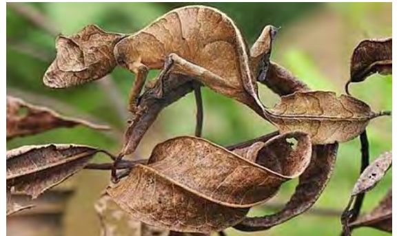
Un insetto mimetizzato quasi indistinguibile da una foglia secca

Accademico dei Lincei, membro del comitato scientifico di Expo 2015. Già professore di Botanica e Fisiologia all'Università di Piacenza, ha diretto istituti per il miglioramento genetico delle piante in Italia e all'estero.